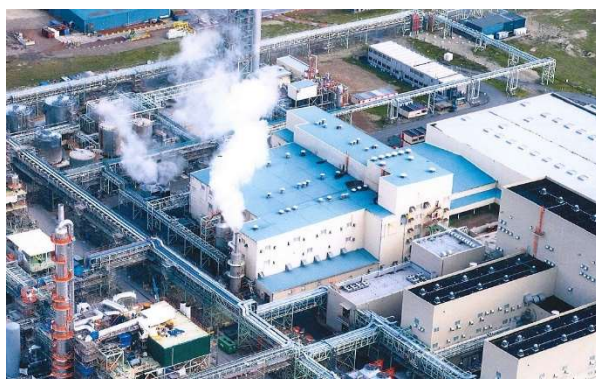
（右）NIPPON SHOKUBAI EUROPE N.V.全景