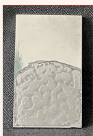
洗浄前 Before cleaning

釜に付着した高重合ジメチコンの洗浄剤 Cleaning agent for high-polymerized dimethicone adhered to the equipment.