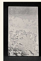
洗浄後 After cleaning

ミネマルは、日本乳化剤株式会社の商標です Minemaru is a trademark of NIPPON NYUKAZAI CO., LTD.