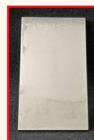
従来品 Conventional product